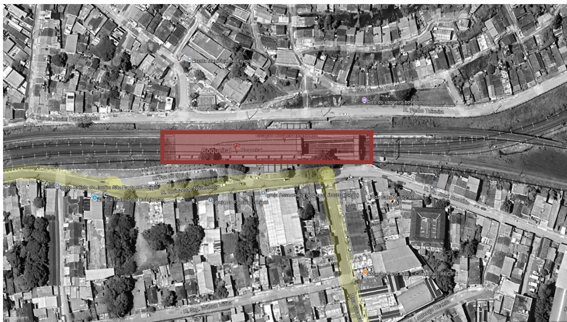
FIGURA 1 – ESTAÇÃO COQUEIRAL